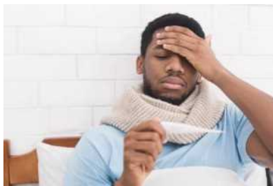
发烧 100.4 华氏度 或以上