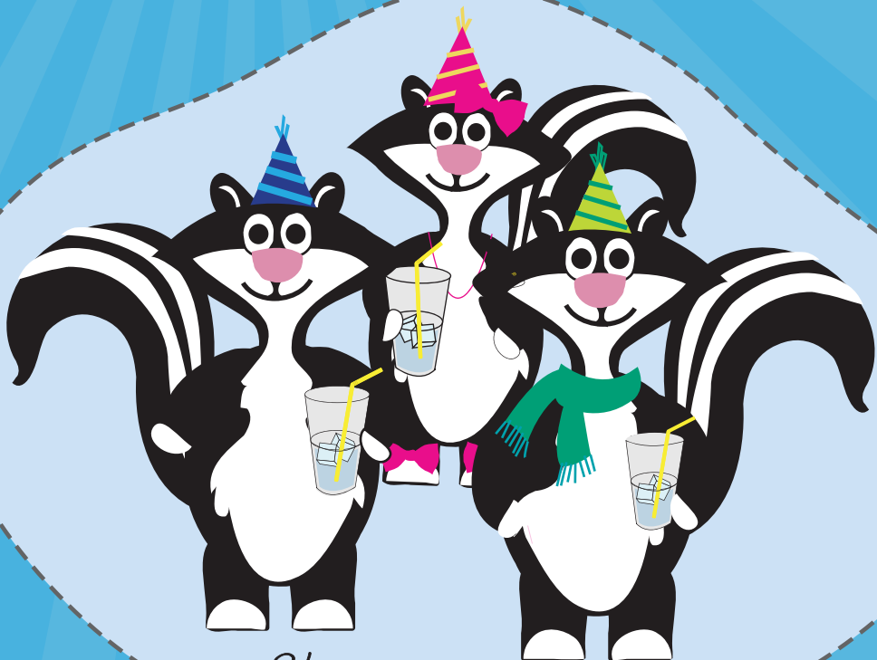
Skunks in a bunch

This material was produced by the California Department of Public Health's Network for a Healthy California with funding from USDA SNAP, known in California as CalFresh (formerly Food Stamps). These institutions are equal opportunity providers and employers. CalFresh provides assistance to low-income households and can help buy nutritious foods for better health. For CalFresh information, call 1-877-847-3663. For important nutrition information, visit www.cachampionsforchange.net .