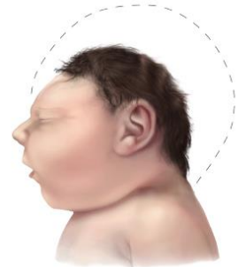
Microcephaly o abnormal na laki ng ulo

Ang impeksyong Zika sa panahong buntis ay maaaring maging sanhi ng pagkakaroon ng fetus ng abnormal na paglago ng utak at higit na maliit kaysa normal na utak, na tinatawag na microcephaly. May iba pang mga problema na natuklasan tulad ng mga depekto sa mata, mga problema sa pandinig at mga problema sa paglaki. Higit na mas marami din ang kaso ng syndrome na Guillain-Barré, isang bihirang abnormalidad sa sistema ng mga ugat (nervous system) sa mga lugar na may Zika.